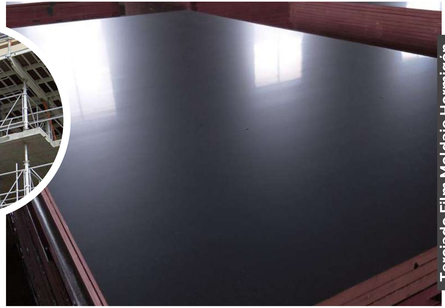
Terciado Film Moldaje Hormigón