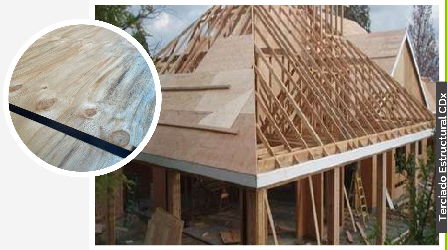
Terciado Estructural CDx